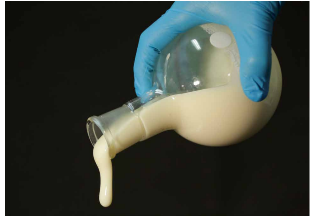
Spinnmasse für die Herstellung keramischer Fasern