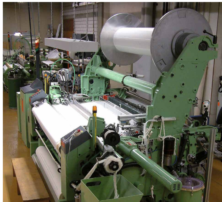
Webtechniken für Faserverbundwerkstoffe

Entwicklung von teilversteiften Strukturen mit Steifigkeitsübergängen im Rahmen der DFG-Forschergruppe HIKE der Universität Stuttgart.