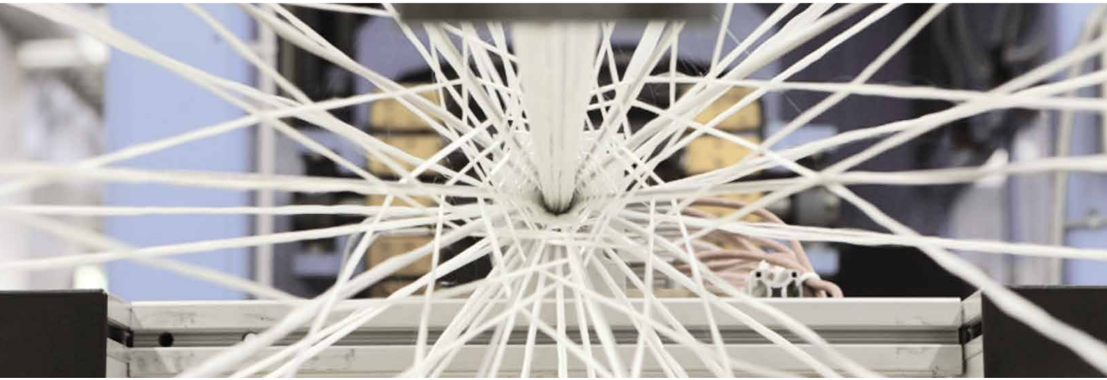
Fasereinfluss bei der Flechtpultrusion