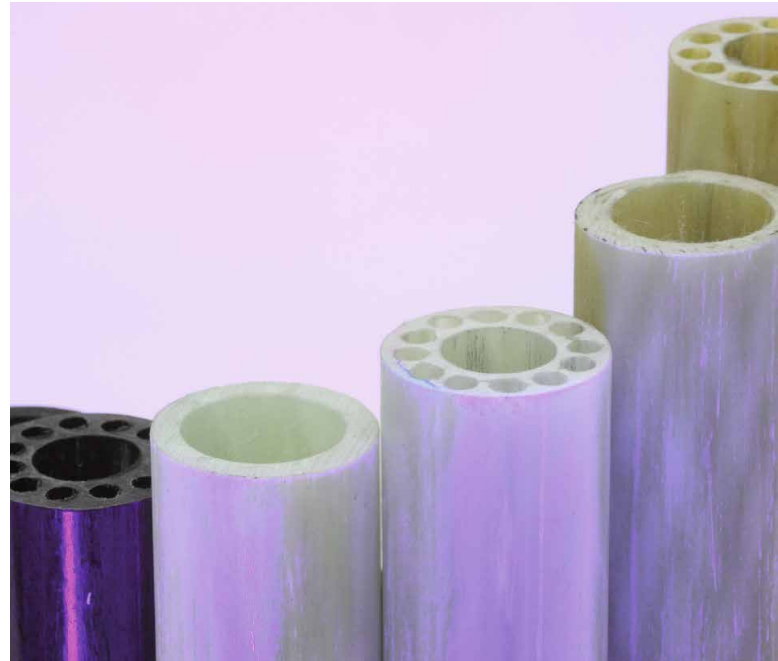
Technische Pflanzenhalme und pultrudierte Rohre

An den DITF steht dazu die gesamte Prozesskette von der Auslegung und Simulation über Textil- und Preformprozesse sowie die Fertigung der Verbundbauteile bis zur Bauteilprüfung zur Verfügung und wird kontinuierlich weiterentwickelt.